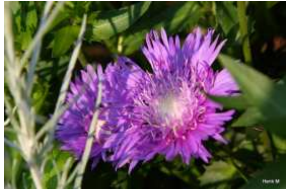
STOKESIA laevis 'Mels Blue'

Tineke de Widt 074-2421418. ( Bij voorkeur tussen 17.00 en 18.00 uur)