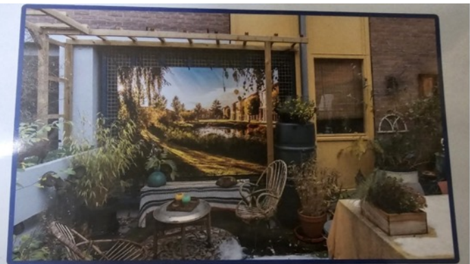
De magie van de KASBAH 'leven in en rondom de creatie van Piet Blom'